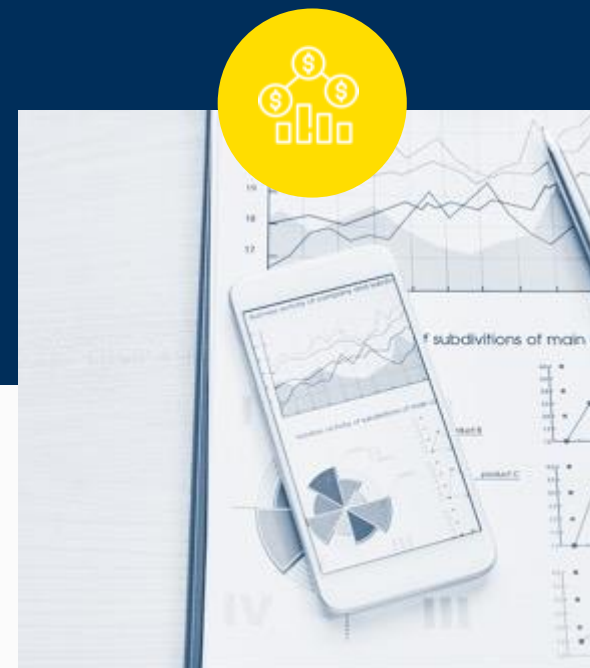
Financiero y Bancario