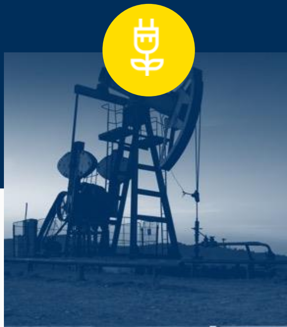
Energía, Infraestructura y Recursos Naturales